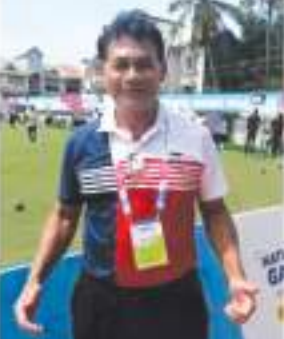
पेशेवर करियर की उपलब्धियों को बयान करता है। लेकिन सचिव के रूप में उनके कार्यकाल ने मलेशिया को उनके 16 साल के कार्यकाल के दौरान नई ऊंचाइयों पर पहुंचा दिया।