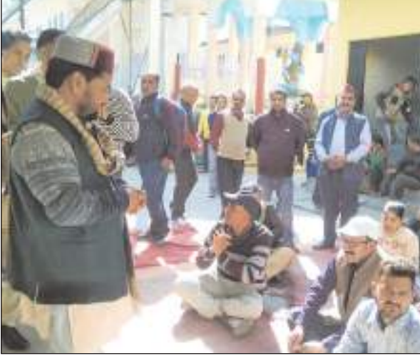
आशवासन दिया, जिसके बाद धरना दे रहे कर्मियों ने अपना धरना स्थगित किया। उत्तरकाशी जिला अस्पताल में

8 विधायक जिला अस्पताल पहुंचे और कर्मचारियों को आरोपियों के खिलाफ ठोस कार्रवाई का आशवासन दिया