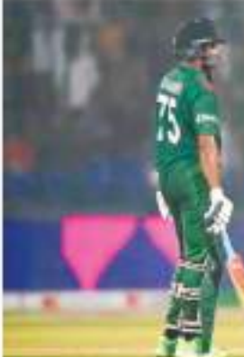
इससे पहले, श्रीलंका ने चरिथ असलंका के शानदार शतक (108 रन) की बढ़ोतरी 279 रन का स्कोर खड़ा किया। असलंका ने पहले धनंजय जोड़े। इसके अलावा, पथुम निरसिका ने भी 41 रनों का योगदान दिया।

श्रीलंका ने तीन विकेट, एंजेलो मैथ्यूज ने दो विकेट और महेश शैखाने ने दो विकेट लेने में सफलता हासिल की।