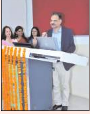
विस्तृत प्रकाश डाला। इस अवसर पर मुख्य