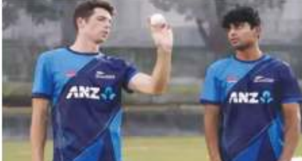
इससे पहले मई में, उन्होंने रवींद्रराय के खिलाफ डरहम के लिए एक काउंटी खेल में दस विकेट हासिल किए थे। फिलिप्स और लेगस्पिनर ईश सोढ़ी दो अन्य स्पिनर हैं।