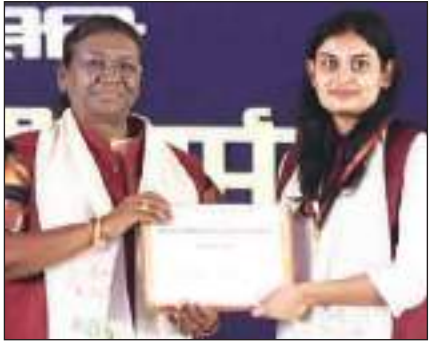
राष्ट्रपति द्रौपदी मुर्मू ने गोविंद बल्लभ पंत कृषि विश्वविद्यालय, पंतनगर के 35वें दीक्षांत समारोह में बतौर मुख्य अतिथि शामिल हुईं।