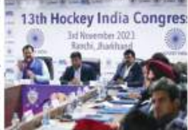
13th Hockey India Congress, 3rd November 2023, Ranchi, Jharkhand. The image shows a group of people at a meeting.

नई दिल्ली। जमीनी स्तर पर युवा प्रतिभाओं को सामने लाने के अपने प्रयास को जारी रखते हुए, हॉकी इंडिया ने मंगलवार को दक्षिणी अल्फा स्पोर्ट्स अकादमी और रितु रानी हॉकी अकादमी को दो नए अकादमी सदस्यों के रूप में शामिल किया है।