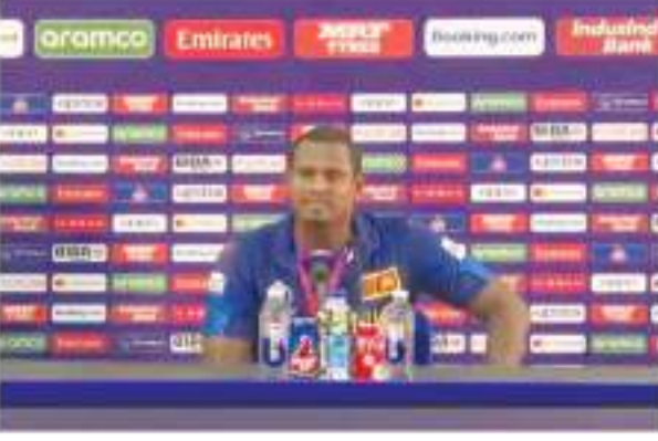
एंजेलो मैथ्यूज ने कहा, जाहिर है, आप सभी जीतने के लिए खेलते हैं। और अगर वह नियम के भीतर है, तो ठीक है। लेकिन नियम के अनुसार दो मिनट के भीतर मैं वहां था। हमारे पास वीडियो सबूत हैं। हम बाद में एक बयान देंगे। हमारे पास वीडियो सबूत, फुटेज हैं, सब कुछ देखा गया। मैं यहां सिर्फ आकर बातें नहीं कह रहा हूँ। मैं वीडियो सबूत है कि जिस समय मैच शुरू हुआ था, और फिर जब मैं क्रीज में चला गया, तब भी मेरे हेल्मेट टूटने के बाद भी पांच सेकंड का समय था। इसलिए, हम खिलाड़ियों की सुरक्षा के बारे में बात करते हैं - अलग लोग मुझे बलाफेंड किया मेरे लिए बिना हेल्मेट पहने गाइड लेना सही है? यह सिर्फ सामान्य ज्ञान है।

नई दिल्ली। श्रीलंका के हरफनमौला खिलाड़ी एंजेलो मैथ्यूज ने अरुण जेटली स्टेडियम में चल रहे विश्व कप में बांग्लादेश के खिलाफ सोमवार को मैच के दौरान अपने आउट होने के तरीके पर निराशा व्यक्त की है।